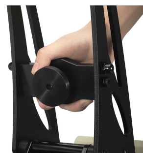
Système Ramspin pour l'ouverture manuelle ou automatique