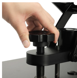
Molette de réglage de la pression